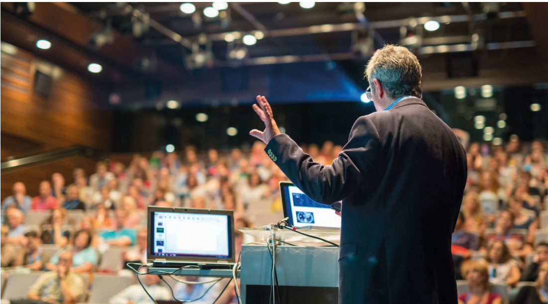
Reputatie Lees meer »