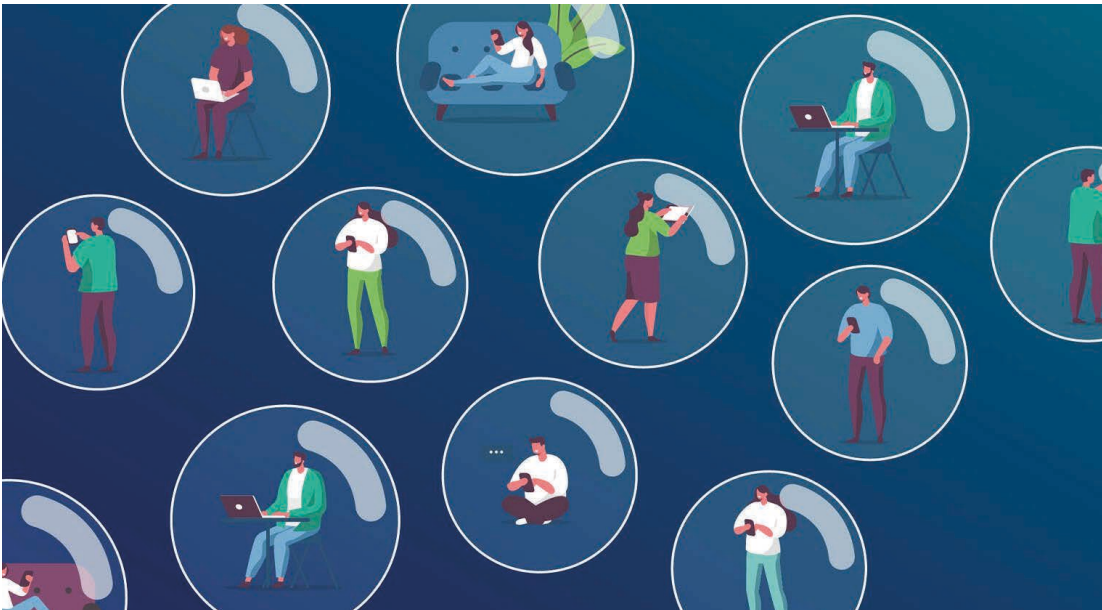
Whitepaper De Mediabubbel Lees meer »