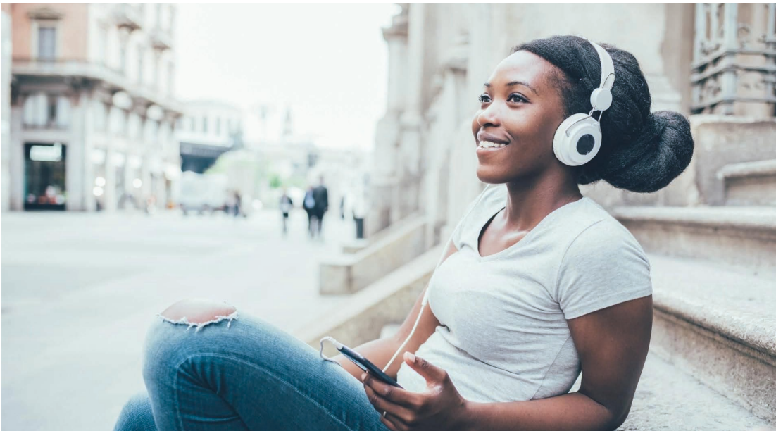
Diversiteit en inclusie Lees meer »