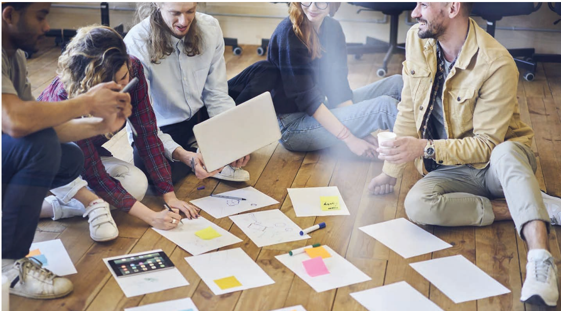
Neuro Lees meer »