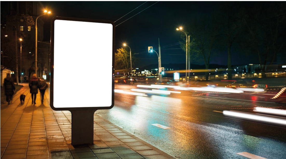
Branding, positionering en communicatie Lees meer »