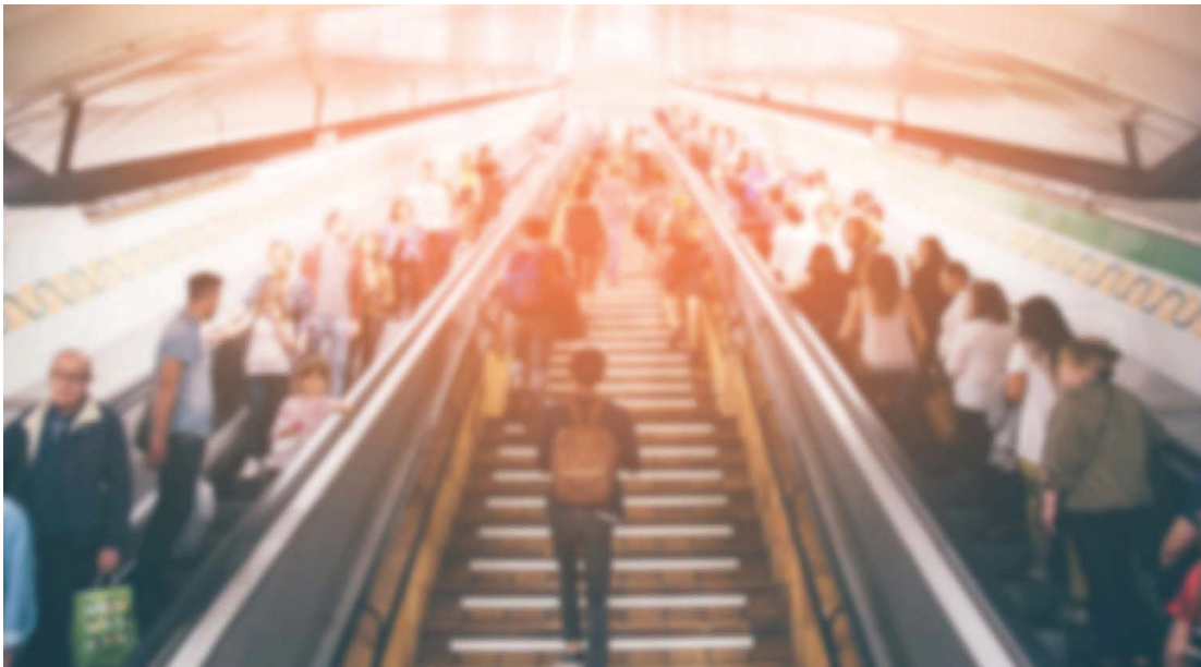
Gedragsbeïnvloeding Lees meer »